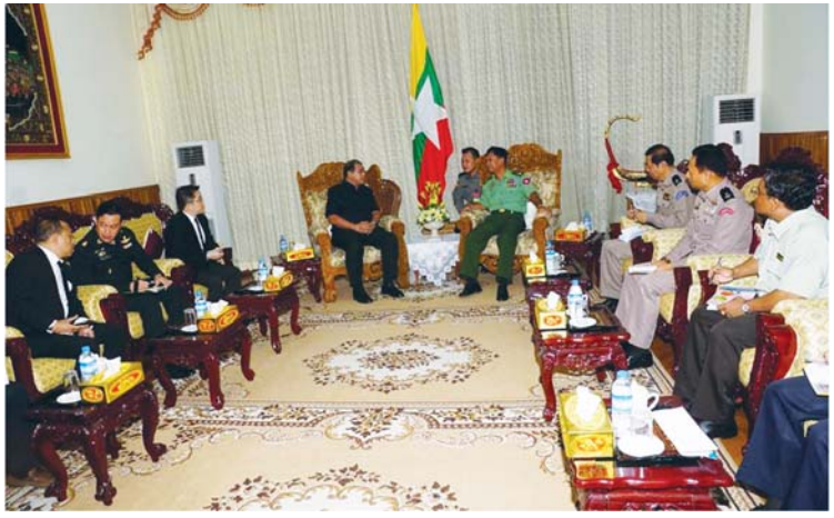
ရင်းနှီးပွင့်လင်းစွာဆွေးနွေးခဲ့ကြကြောင်း သတင်းရရှိပါသည်။

အကျဉ်းဦးစီးဌာန ညွှန်ကြားရေးမှူးချုပ် ဦးသိန်းဦး၊ ပြည်ထဲရေးဝန်ကြီးဌာန ဒုတိယအမြဲတမ်းအတွင်းဝန် ဦးခိုင်ထွန်းဦး၊ မြန်မာနိုင်ငံရဲတပ်ဖွဲ့ နိုင်ငံခြားကျော်မှုခင်းဌာနကြီးမှ ဌာနကြီးမှူး ရဲမှူးချုပ် အောင်ဌေးမြင့်နှင့် ပြည်ထဲရေးဝန်ကြီးဌာန လက်ထောက်အတွင်းဝန် ဦးမောင်မောင်မြင့်တို့ တက်ရောက်ခဲ့ကြပါသည်။ တွေ့ဆုံစဉ် ရဲတပ်ဖွဲ့ဝင်များအတွက် လေ့ကျင့်ရေးဆိုင်ရာကိစ္စရပ်များ၊ မူးယစ်ဆေးဝါးတားဆီးနှိမ်နင်းရေးဆိုင်ရာကိစ္စရပ်များ၊ နှစ်နိုင်ငံပူးပေါင်းဆောင်ရွက်ရေးဆိုင်ရာကိစ္စရပ်များနှင့် စပ်လျဉ်း၍