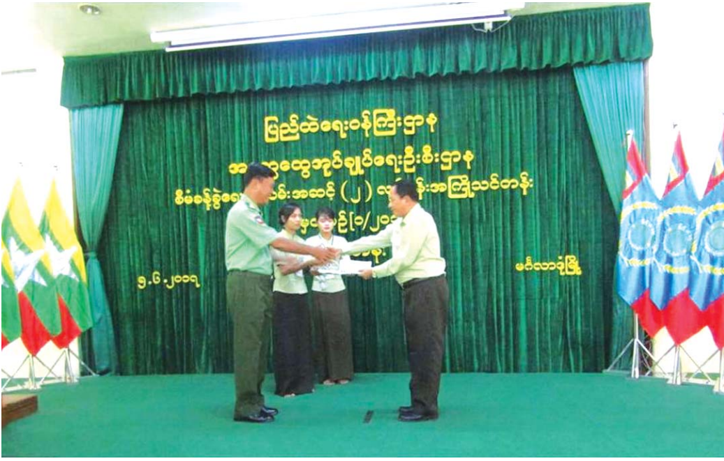
ပြည်ထဲရေးဝန်ကြီးဌာန၊ ပြည်ထောင်စုဝန်ကြီး ဒုတိယဗိုလ်ချုပ်ကြီးကျော်ဆွေသည် ၅-၆-၂၀၁၇ ရက်နေ့၊ (၁၀း၃၀) နာရီတွင် အထွေထွေအုပ်ချုပ်ရေးဦးစီးဌာန၊ အုပ်ချုပ်ရေးပညာဖွံ့ဖြိုးမှုသင်တန်းကျောင်း (မင်္ဂလာဒုံ)သို့ ရောက်ရှိခဲ့ရာ

သင်တန်းကျောင်းခန်းမ၌ စီမံခန့်ခွဲရေးဝန်ထမ်း အဆင့်(၂)၊ လုပ်ငန်းအင်္ဂါ ပြင်ဆင်ရေးအမှတ်စဉ် (၁/၂၀၁၇)သင်တန်းသား/သူ (၂၃၄)ဦးနှင့်သင်တန်း ကျောင်းမှဝန်ထမ်းများအား တွေ့ဆုံလမ်းညွှန်အမှာ စကားပြောကြားခဲ့ပြီး ဝန်ထမ်း(၈၀)ဦး နှင့် သင်တန်း သား/ သူများအား ကျပ်(၁၀,၀၀၀) နှုန်းဖြင့် ထောက်ပံ့ခဲ့ပါသည်။