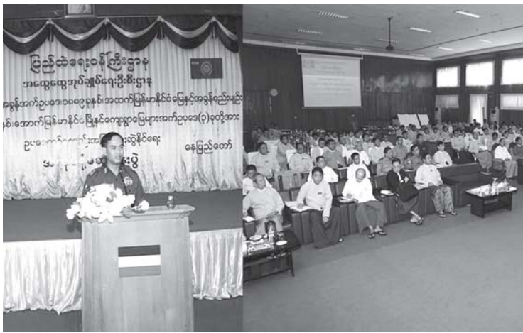
ပြည်ထဲရေးဝန်ကြီးဌာန၊ ဒုတိယဝန်ကြီးမှ အလုပ်ရုံဆွေးနွေးပွဲနှင့် ပတ်သက်၍ အမှာစကားပြောကြားစဉ်

ပြည်ထဲရေးဝန်ကြီးဌာန၊ အထွေထွေအုပ်ချုပ်ရေးဦးစီးဌာနတွင် လက်ရှိ ကျင့်သုံးလျက်ရှိသော မြေယာဥပဒေသုံးခုအား တစ်ခုတည်းအဖြစ်ပေါင်းစည်းနိုင်ရေး အလုပ်ရုံဆွေးနွေးပွဲကို ဇွန် ၂၈နှင့် ၂၉ ရက်နေ့တို့တွင် နေပြည်တော် ရုံးအမှတ် (၁၀) ရှိ ပြည်ထဲရေးဝန်ကြီးဌာန စုစည်းခန်းမ၌ ကျင်းပသည်။ အခမ်းအနားတွင် ပြည်ထဲရေးဝန်ကြီးဌာန၊ ပြည်ထောင်စုဝန်ကြီး ဒုတိယဗိုလ်ချုပ်ကြီး ကျော်ဆွေက