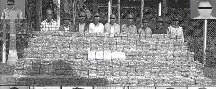
တပ်မတော်(ရေ)မှ ၂၂-၁-၂၀၂၄ ရက်နေ့ ၁၅၃၀ အချိန်တွင် ရောဝတီတိုင်းဒေသကြီး၊ လပွတ္တာမြို့နယ်၊ ဟိုင်းကြီးကျွန်းမြို့အနီး ပင်လယ်ပြင်၌ အေးမြတ်အောင်စက်လှေကို မသင်္ကာဖွယ်တွေ့ရှိသဖြင့် စစ်ဆေးခဲ့ရာ စက်လှေပေါ်တွင် မူးယစ်ဆေးဝါးများ