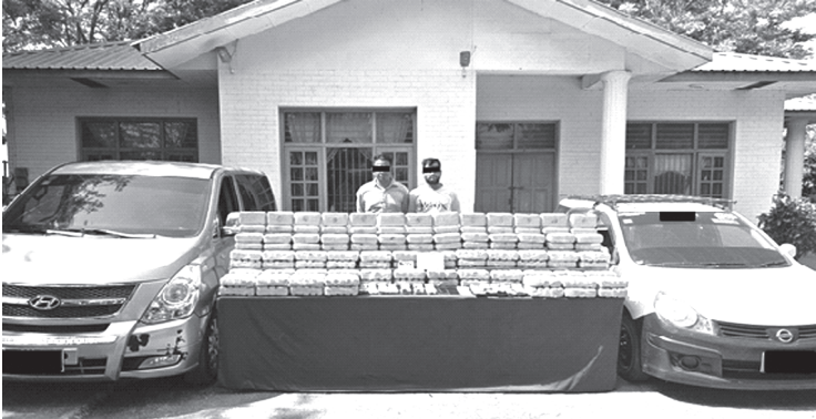
မူးယစ်ဆေးဝါးတားဆီးနှိမ်နင်းရေးရဲတပ်ဖွဲ့မှ တပ်ဖွဲ့ဝင်များပါဝင်သော ပူးပေါင်းအဖွဲ့သည် ၂၈-၂-၂၀၂၄ ရက်နေ့ ၁၂၃၀ အချိန်တွင် နောင်ချိုမြို့၊ အိုရီယမ်တယ်တိုးဂိတ်