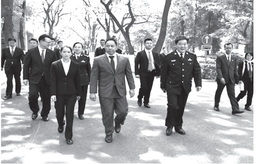
တရုတ်ပြည်သူ့သမ္မတနိုင်ငံအတွင်း အလုပ်သဘောခရီးစဉ်သွားရောက်ခဲ့စဉ်

နိုင်ငံတော်စီမံအုပ်ချုပ်ရေးကောင်စီအဖွဲ့ဝင် ပြည်ထဲရေးဝန်ကြီးဌာန ပြည်ထောင်စုဝန်ကြီး ဒုတိယဗိုလ်ချုပ်ကြီး ရာပြည့် ဦးဆောင်သော မြန်မာ ကိုယ်စားလှယ်အဖွဲ့သည် တရုတ်ပြည်သူ့သမ္မတနိုင်ငံ၊ နိုင်ငံတော်ကောင်စီဝင် ပြည်သူ့လုံခြုံရေးဆိုင်ရာဝန်ကြီးဌာန၊ ဝန်ကြီး H.E. Mr. Wang Xiao Hong ၏ ဖိတ်ကြားချက်အရ ၂၄-၄-၂၀၂၄ ရက်နေ့မှ ၂၉-၄-၂၀၂၄ ရက်နေ့အထိ မြန်မာ-တရုတ် နှစ်နိုင်ငံ တရားဥပဒေစိုးမိုးရေးနှင့် လုံခြုံရေးဆိုင်ရာ ပူးပေါင်းဆောင်ရွက်မှုကိစ္စရပ်များကို ဆွေးနွေးဆောင်ရွက်နိုင်ရေးအတွက် တရုတ်ပြည်သူ့သမ္မတနိုင်ငံသို့ အလုပ်သဘောခရီးစဉ် သွားရောက်ခဲ့ပါသည်။ နိုင်ငံတော်စီမံအုပ်ချုပ်ရေးကောင်စီအဖွဲ့ဝင် ပြည်ထဲရေးဝန်ကြီးဌာန ပြည်ထောင်စုဝန်ကြီး ဒုတိယဗိုလ်ချုပ်ကြီး ရာပြည့် ဦးဆောင်သော မြန်မာ ကိုယ်စားလှယ်အဖွဲ့သည် တရုတ်နိုင်ငံ၊ ပေကျင်းမြို့သို့ ၂၄-၄-၂၀၂၄ ရက်နေ့၊ ၂၀၅၅ အချိန်တွင် ရောက်ရှိခဲ့ပါသည်။ ပြည်ထောင်စုဝန်ကြီး ဦးဆောင်သော မြန်မာ ကိုယ်စားလှယ်အဖွဲ့အား တရုတ်ပြည်သူ့သမ္မတနိုင်ငံ၊ ပြည်သူ့လုံခြုံရေးဆိုင်ရာဝန်ကြီးဌာန ဒုတိယဝန်ကြီး