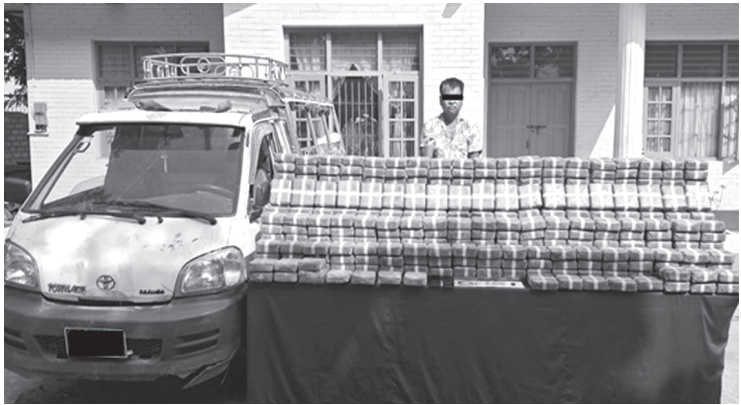
မူးယစ်ဆေးဝါးတားဆီးနှိမ်နင်းရေးရဲတပ်ဖွဲ့နှင့် လုံခြုံရေးတပ်ဖွဲ့ဝင်များပါဝင်သော ပူးပေါင်းအဖွဲ့သည် ၃-၅-၂၀၂၄ ရက်နေ့ ၁၇၃၀ အချိန်တွင် ရှမ်းပြည်နယ်

(မြောက်ပိုင်း)၊ နောင်ချိုမြို့နယ်၊ ဒုဥဝတီတံတားအနီးတွင် ရပ်စောက်ဘက်မှ နောင်ချိုဘက်သို့ ညီညီအောင် မောင်းနှင်လာသည့် LIGHT TRUCK မော်တော်ယာဉ်ကို စစ်ဆေးရန်ရပ်တန့်ခိုင်းစဉ် စစ်ဆေးမခံဘဲ အရှိန်တင်မောင်းနှင်ထွက်ပြေးသဖြင့် ပူးပေါင်းအဖွဲ့မှ ပိတ်ဆို့ဖမ်းဆီးခဲ့ရာ နောင်ချိုမြို့နယ်၊ မကျည်းရေကျေးရွာအနီး၊ နောင်ချို-ရပ်စောက်သွားကားလမ်း၊ မိုင်တိုင်အမှတ် ၁၁၇/၃ အနီး လမ်းဘေးရှိ ချောက်အတွင်းသို့ ထိုးကျတိမ်းမောက်သွားစဉ် ညီညီအောင်အား ဖမ်းဆီးရမိခဲ့ပြီး အဆိုပါယာဉ်ပေါ်တွင် သိုလှက်သယ်ဆောင်လာသည့် ဒေသကာလ တန်ဖိုးငွေကျပ်သိန်း ၇,၅၀၀ တန်ဖိုးရှိ စိတ်ကြွေးသွပ်ဆေးပြား ၁၅ သိန်း သိမ်းဆည်းရမိခဲ့ကြောင်း၊ စစ်ဆေးဖော်ထုတ်ချက်အရ သိမ်းဆည်းရမိ စိတ်ကြွေးသွပ်ဆေးပြားများအား ရှမ်းပြည်နယ်မှ မန္တလေးတိုင်းဒေသကြီးသို့ သယ်ဆောင်ခြင်းဖြစ်ကြောင်း သိရှိရသဖြင့် ၎င်းအား ဥပဒေအရအရေးယူထားရှိပြီး ကွင်းဆက်ပြစ်မှုကျူးလွန်သူများအား ဆက်လက်စစ်ဆေး ဖော်ထုတ်လျက်ရှိကြောင်း သတင်းရရှိသည်။