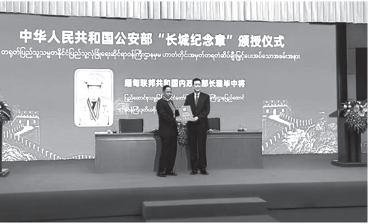
Golden Great Wall Commemorative Medal အား ပြည်ထောင်စုဝန်ကြီးလက်ခံရယူစဉ်