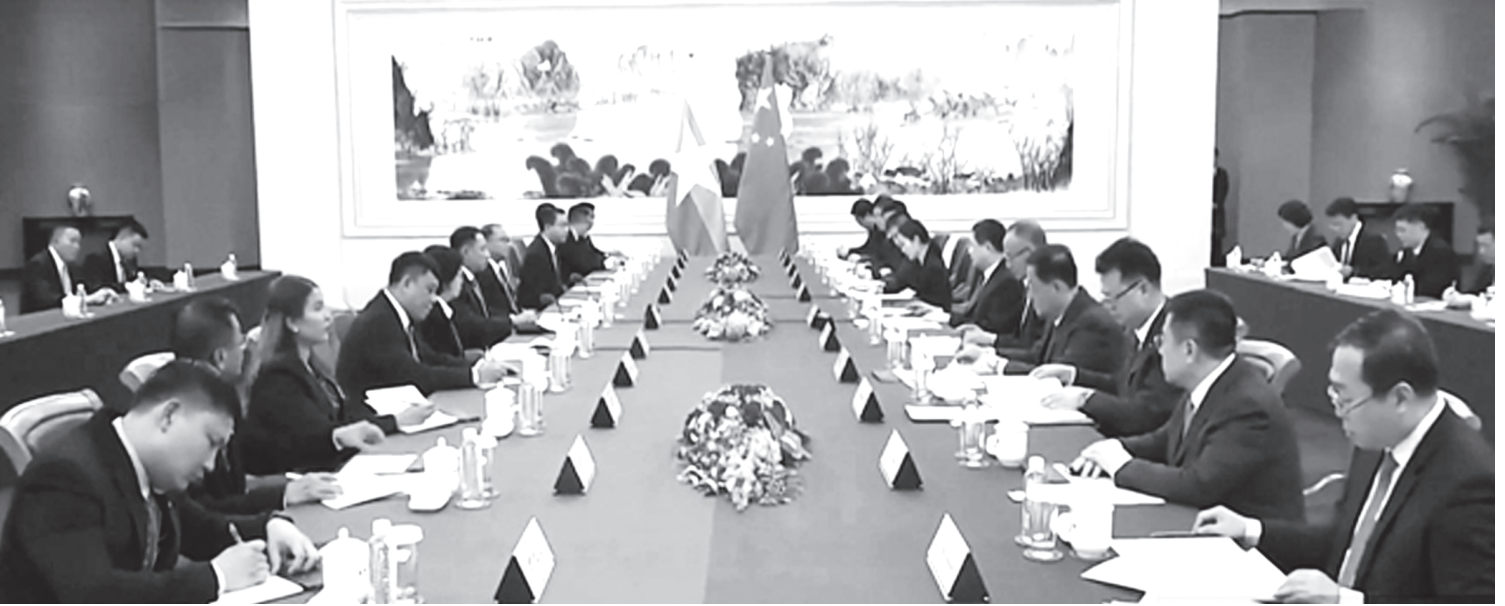
၂၅-၄-၂၀၂၄ ရက်နေ့တွင် နှစ်နိုင်ငံဝန်ကြီးအဆင့် အစည်းအဝေးပြုလုပ်နေစဉ်

နိုင်ငံတော်စီမံအုပ်ချုပ်ရေးကောင်စီအဖွဲ့ဝင် ပြည်ထဲရေးဝန်ကြီးဌာန ပြည်ထောင်စုဝန်ကြီး ဒုတိယဗိုလ်ချုပ်ကြီး ရာပြည့် တရုတ်ပြည်သူ့သမ္မတနိုင်ငံ ပေကျင်းရဲတက္ကသိုလ်သို့ သွားရောက်လေ့လာတက်ရောက်ကာ မြန်မာနိုင်ငံရဲတပ်ဖွဲ့အတွက် ယွမ် ၅ သန်းတန်ဖိုးရှိ အကူအညီပေးရေးစာလွှာအား လက်မှတ်ရေးထိုးလဲလှယ်ပြီး တရုတ်ပြည်သူ့သမ္မတနိုင်ငံ၊ ပြည်သူ့လုံခြုံရေးဝန်ကြီးဌာနက ချီးမြှင့်ပေးအပ်သော အမြင့်ဆုံးဆုတံဆိပ်ဖြစ်သည့် Golden Great Wall Commemorative Medal ဆုတံဆိပ်အား လက်ခံရယူ