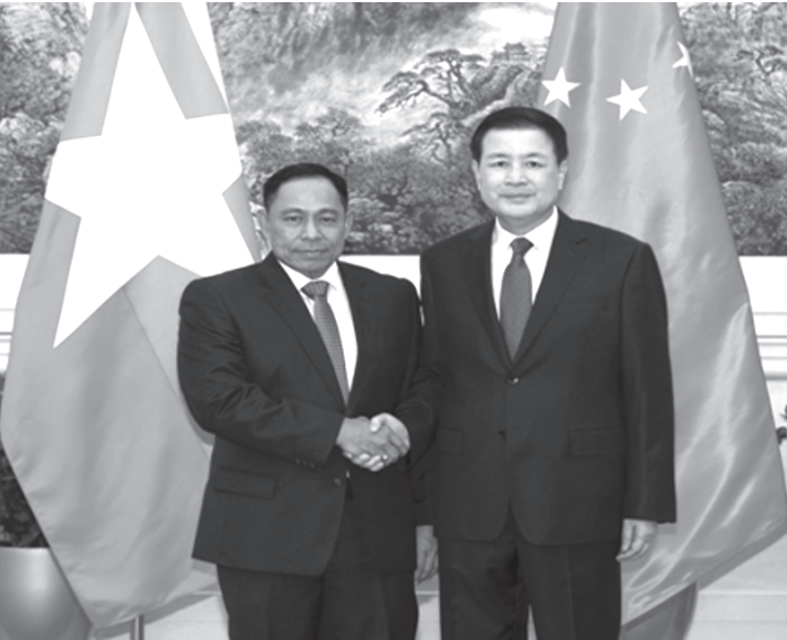
၂၅-၄-၂၀၂၄ ရက်နေ့တွင် ပြည်ထဲရေးဝန်ကြီးဌာန၊ ပြည်ထောင်စုဝန်ကြီးနှင့် တရုတ်ပြည်သူ့သမ္မတနိုင်ငံ ပြည်သူ့လုံခြုံရေးဆိုင်ရာဝန်ကြီးတို့အား ပေကျင်းဝေအန်းဟိုတယ်၌ ဂုဏ်ပြုတပ်ဖွဲ့မှကြိုဆိုကြစဉ်