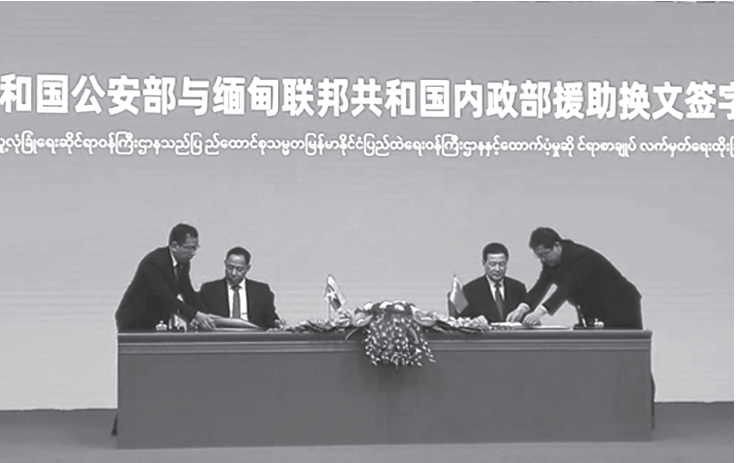
တရုတ်ပြည်သူ့သမ္မတနိုင်ငံ၊ ပြည်သူ့လုံခြုံရေးဆိုင်ရာဝန်ကြီးဌာနနှင့် ပြည်ထောင်စုသမ္မတမြန်မာနိုင်ငံ ပြည်ထဲရေးဝန်ကြီးဌာနတို့ ထောက်ပံ့မှုဆိုင်ရာ စာချုပ်အား လက်မှတ်ရေးထိုးနေစဉ်

နိုင်ငံတော်စီမံအုပ်ချုပ်ရေးကောင်စီအဖွဲ့ဝင် ပြည်ထဲရေးဝန်ကြီးဌာန ပြည်ထောင်စုဝန်ကြီး ဒုတိယဗိုလ်ချုပ်ကြီး ရာပြည့် ဦးဆောင်သော မြန်မာ ကိုယ်စားလှယ်အဖွဲ့သည် တရုတ်ပြည်သူ့သမ္မတနိုင်ငံ၊ နိုင်ငံတော်ကောင်စီဝင် ပြည်သူ့လုံခြုံရေးဆိုင်ရာဝန်ကြီးဌာန၊ ဝန်ကြီး H.E. Mr. Wang Xiao Hong ၏ ဖိတ်ကြားချက်အရ ၂၄-၄-၂၀၂၄ ရက်နေ့မှ ၂၉-၄-၂၀၂၄ ရက်နေ့အထိ မြန်မာ-တရုတ် နှစ်နိုင်ငံ တရားဥပဒေစိုးမိုးရေးနှင့် လုံခြုံရေးဆိုင်ရာ ပူးပေါင်းဆောင်ရွက်မှုကိစ္စရပ်များကို ဆွေးနွေးဆောင်ရွက်နိုင်ရေးအတွက် တရုတ်ပြည်သူ့သမ္မတနိုင်ငံသို့ အလုပ်သဘောခရီးစဉ် သွားရောက်ခဲ့ပါသည်။ နိုင်ငံတော်စီမံအုပ်ချုပ်ရေးကောင်စီအဖွဲ့ဝင် ပြည်ထဲရေးဝန်ကြီးဌာန ပြည်ထောင်စုဝန်ကြီး ဒုတိယဗိုလ်ချုပ်ကြီး ရာပြည့် ဦးဆောင်သော မြန်မာ ကိုယ်စားလှယ်အဖွဲ့သည် တရုတ်နိုင်ငံ၊ ပေကျင်းမြို့သို့ ၂၄-၄-၂၀၂၄ ရက်နေ့၊ ၂၀၅၅ အချိန်တွင် ရောက်ရှိခဲ့ပါသည်။ ပြည်ထောင်စုဝန်ကြီး ဦးဆောင်သော မြန်မာ ကိုယ်စားလှယ်အဖွဲ့အား တရုတ်ပြည်သူ့သမ္မတနိုင်ငံ၊ ပြည်သူ့လုံခြုံရေးဆိုင်ရာဝန်ကြီးဌာန ဒုတိယဝန်ကြီး