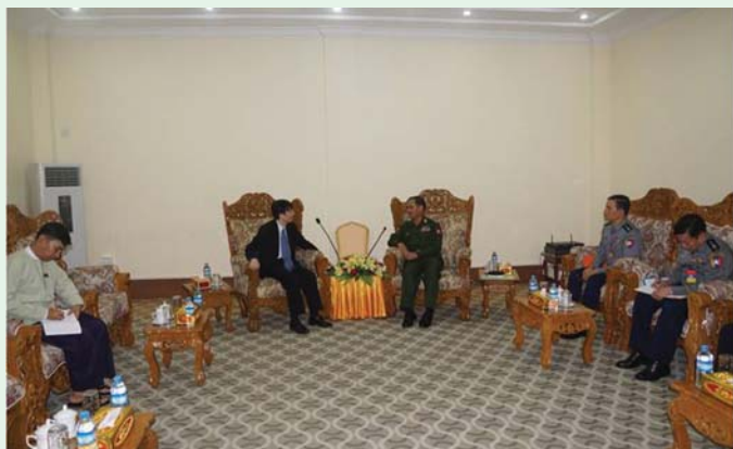
ပြည်ထဲရေးဝန်ကြီးဌာန၊ ဒုတိယဝန်ကြီး ဗိုလ်ချုပ်အောင်စိုးသည် ကိုရီးယားသမ္မတနိုင်ငံသံရုံး၊ သံရုံးယာယီတာဝန်ခံ Mr.Kim Jung Han

ဦးဆောင်သောကိုယ်စားလှယ်အဖွဲ့အား ၁၃-၉-၂၀၁၇ ရက်နေ့ ၁၁:၀၀ နာရီအချိန်တွင် နေပြည်တော်၊ ပြည်ထဲရေးဝန်ကြီးဌာန၊ ရုံးအမှတ် (၃၈)ရှိ ဒုတိယဝန်ကြီး၏ ဧည့်ခန်းမ၌ လက်ခံတွေ့ဆုံခဲ့ပါသည်။ ထိုသို့တွေ့ဆုံရာတွင် ဒုတိယဝန်ကြီးနှင့်အတူ မြန်မာနိုင်ငံရဲတပ်ဖွဲ့မှ ညွှန်ကြားရေးမှူး (လုံခြုံရေး) ရဲမှူးကြီးကျော်ကျော်ဟန်၊ နိုင်ငံခြံတ်ကျော်မှုခင်းဌာနကြီးမှ ဒုတိယဌာနကြီးမှူး ရဲမှူးကြီး တင်အောင်ဝင်းနှင့် သတင်းရဲတပ်ဖွဲ့မှ ဌာနမှူး (နိုင်ငံတကာ) ရဲမှူးကြီး ကျော်သီဟတို့ တက်ရောက်ခဲ့ကြပါသည်။ တွေ့ဆုံစဉ် ငွေကြေးခဝါချမှု တိုက်ဖျက်ရေး ဆောင်ရွက်နေမှုများ၊ မှုခင်းသိပ္ပံဘာသာရပ်ဆိုင်ရာနည်းပညာ ပူးပေါင်းဆောင်ရွက်ရေးကိစ္စရပ်များ၊ နိုင်ငံအတွင်းရှိ ကိုရီးယားနိုင်ငံသားများနှင့် ပတ်သက်သောကိစ္စရပ်များ၊ ရခိုင်ပြည်နယ်အတွင်း တည်ငြိမ်အေးချမ်းရေးရရှိရန် ဆောင်ရွက်နေမှုများနှင့် စပ်လျဉ်း၍ရင်းနှီးပွင့်လင်းစွာ အမြင်ချင်းဖလှယ် ဆွေးနွေးခဲ့ကြကြောင်း သတင်းရရှိပါသည်။