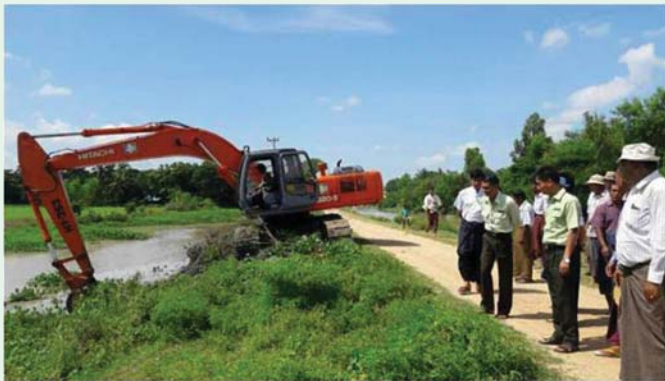
များသို့ ရေဝင်ရောက်မှုကို လျော့နည်းသက်သာစေမည်ဖြစ်ကြောင်း သတင်းရရှိပါသည်

၄-၉-၂၀၁၇ ရက်နေ့တွင် စစ်ကိုင်းတိုင်းဒေသကြီး၊ ရွှေဘိုခရိုင်၊ ဝက်လက်မြို့နယ်၊ ပြဿဒ်ရေဆိုးချောင်းရေ လမ်းချဲ့ထွင်ခြင်းလုပ်ငန်းကို ရွှေဘိုခရိုင် စီမံခန့်ခွဲမှုကော်မတီဥက္ကဋ္ဌ၊ မြို့နယ်စီမံခန့်ခွဲမှုကော်မတီဥက္ကဋ္ဌနှင့် မြို့နယ်မှ တာဝန်ရှိသူများ စုစုပေါင်းအင်အား(၃၀)ဦးဖြင့် ကွင်းဆင်းကြည့်ရှုစစ်ဆေးခဲ့ပါသည်။ အဆိုပါ ပြဿဒ်ရေဆိုးချောင်းရေလမ်းချဲ့ထွင်ခြင်းလုပ်ငန်းကို စစ်ကိုင်းတိုင်းဒေသကြီးအစိုးရအဖွဲ့၏ စက်သုံးဆီဂါလ်(၉၀၀)ပုံပိုးကူညီမှုဖြင့် ခရိုင်/မြို့နယ်စီမံခန့်ခွဲမှုကော်မတီ၏ အနီးကပ်ကြီးကြပ်မှု၊ ဆည်မြောင်းနှင့် ရေအသုံးချမှုစီမံခန့်ခွဲရေးဦးစီးဌာနမှ စက်ယန္တရားဖြင့် ပူးပေါင်းအကောင်အထည်ဖော်ဆောင်ရွက်ခြင်းဖြစ်ပါသည်။ ယင်းရေဆိုးချောင်းမှာ (၈)မိုင်ခန့် ရှည်လျားပြီး ယခုကဲ့သို့ ရေလမ်းချဲ့ထွင်ပေးခြင်းဖြင့် မိုးရာသီတွင် စိုင့်နိုင်၊ သားနား၊ မောက်ကြိုး၊ ရွှေကျင်နှင့် လှတောကျေးရွာ အုပ်စုတို့ရှိ လယ်မြေကေ(၄၀၀၀)ကျော်အား နှစ်စဉ်ရေကြီးရေလျှံဖြစ်ပေါ်မှုမှ ကာကွယ်ပေးနိုင်သည့်အပြင် စိုင့်နိုင်၊ သားနားနှင့် မောက်ကြိုးကျေးရွာတို့ရှိ လူနေအိမ်ခြေ