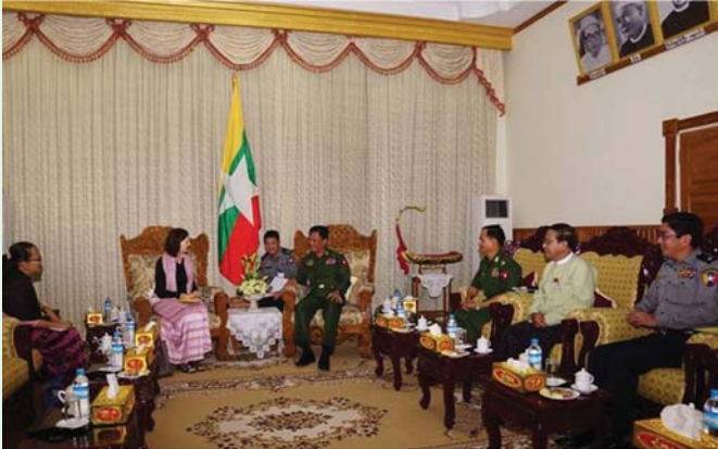
ပြည်ထဲရေးဝန်ကြီးဌာန၊ ပြည်ထောင်စုဝန်ကြီး ဒုတိယဗိုလ်ချုပ်ကြီး ကျော်ဆွေသည် ကုလသမဂ္ဂဌာန ညှိနှိုင်းရေးမှူး Ms. Renata Dessallien

ဦးဆောင် သောကိုယ်စားလှယ်အဖွဲ့အား ၂၃-၈-၂၀၁၇ ရက်နေ့ ၀၉:၀၀ နာရီအချိန်တွင် နေပြည်တော်၊ ပြည်ထဲရေးဝန်ကြီးဌာန၊ ရုံးအမှတ် (၁၀)ရှိ ပြည်ထောင်စုဝန်ကြီး၏ ဧည့်ခန်းမ၌ လက်ခံတွေ့ဆုံခဲ့ပါသည်။ ထိုသို့ တွေ့ဆုံရာတွင် ပြည်ထောင်စုဝန်ကြီးနှင့်အတူ ဒုတိယဝန်ကြီးဗိုလ်ချုပ်အောင်စိုး၊ အမြဲတမ်းအတွင်းဝန် ဦးတင်မြင့်နှင့် မြန်မာနိုင်ငံ ရဲတပ်ဖွဲ့ ရဲချုပ် ရဲချုပ် အောင်ဝင်းဦးတို့ တက်ရောက်ခဲ့ကြပါသည်။ တွေ့ဆုံစဉ် ရခိုင်ပြည်နယ် အတွင်း ဒေသတည်ငြိမ်ရေးဆောင်ရွက်နေမှု အခြေအနေများ၊ မူးယစ်ဆေးဝါး တားဆီးနှိမ်နင်းရေး ကိစ္စရပ်များ၊ ပူးပေါင်းဆောင်ရွက်ရေးကိစ္စများနှင့် စပ်လျဉ်း၍ ရင်းနှီးပွင့်လင်းစွာ အမြင်ချင်းဖလှယ် ဆွေးနွေးခဲ့ကြကြောင်း သတင်းရရှိပါသည်။