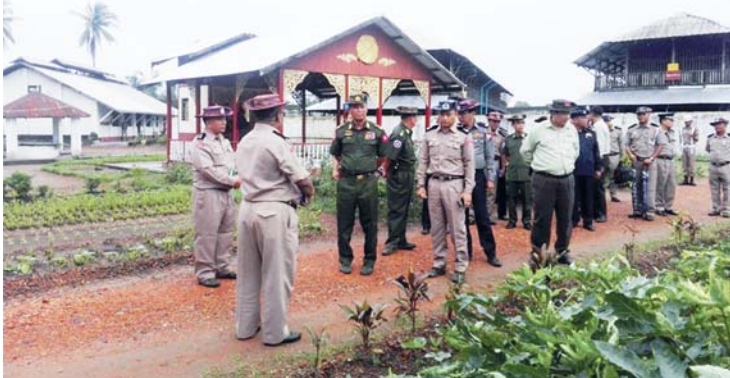
ပြည်ထဲရေးဝန်ကြီးဌာန၊ ပြည်ထောင်စုဝန်ကြီး ဒုတိယဗိုလ်ချုပ်ကြီး ကျော်ဆွေသည် အကျဉ်းဦးစီးဌာန၊ ရခိုင်ပြည်နယ်ဦးစီးမှူးရုံးကွပ်ကဲမှုအောက်ရှိ စစ်တွေနှင့်ဘူးသီးတောင်

အကျဉ်းထောင်သို့ ၂၀-၆-၂၀၁၇ ရက်နေ့တွင် ရောက်ရှိစစ်ဆေးခဲ့ရာ ညွှန်ကြားရေးမှူး ဦးဝင်းနိုင်လင်းမှ မုန်တိုင်းတိုက်ခတ်မှုကြောင့်ပျက်စီးခဲ့သော အဆောက်အဦများ ပြင်ဆင်ပြီးစီးမှုအခြေအနေ၊ ပြုပြင်ဆောင်ရွက်ဆဲအခြေအနေများနှင့် ဦး၊ ရေး၊ ထောက် လုပ်ငန်းဆိုင်ရာများရှင်းလင်းတင်ပြခဲ့ပါသည်။